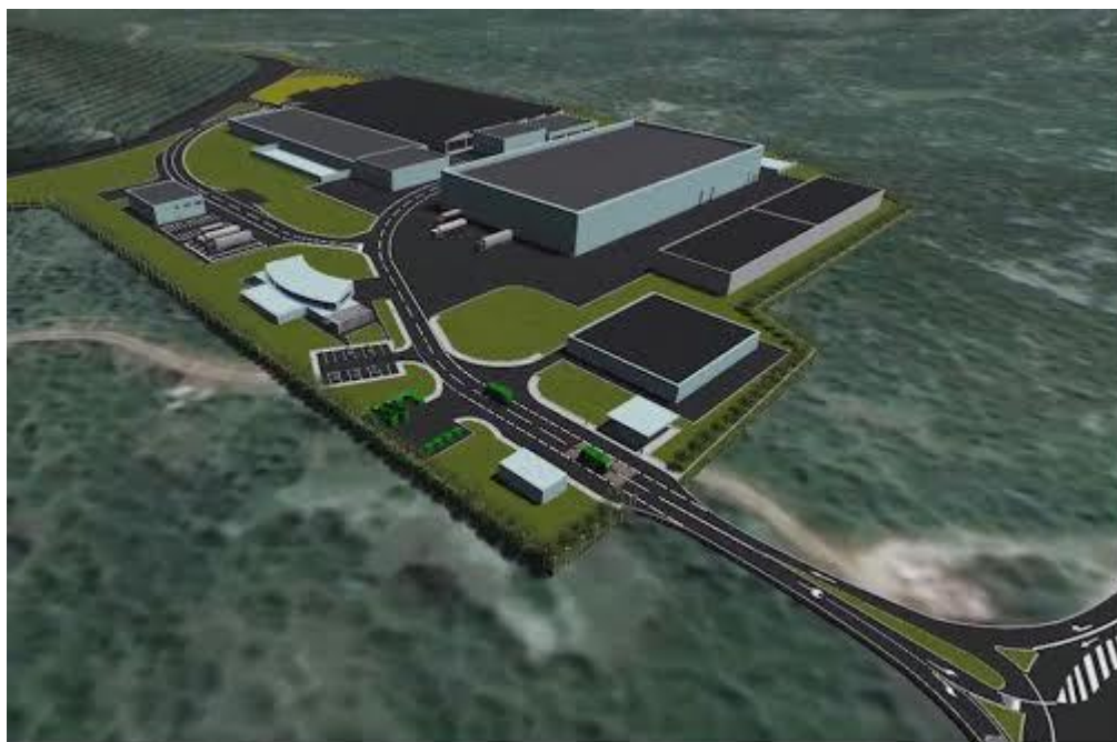
Slika 3: CGO Splitsko-dalmatinske županije

Centar za gospodarenje otpadom (CGO) je sklop međusobno funkcionalno i/ili tehnološki povezanih građevina i uređaja za obradu komunalnog otpada. Projekt izgradnje CGO uključuje i izgradnju šest pretovarnih stanica (u Splitu, Sinju, Zagvozdu te na otocima Brač, Hvar i Vis). Dio otpada nastao u blizini dopremat će se izravno u CGO, dok će se otpad iz udaljeni(ji)h dijelova Županije transportirati do pretovarnih stanica.