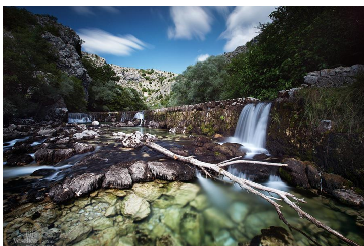
Slika 2: Rijeka Rumin u značajnom krajobrazu Rumin

Na području Općine nalaze se i dva područja očuvanja ekološke mreže značajno za vrste i stanišne tipove (POVS) HR 5000028 Dinara i HR 201313 Srednji tok Cetine s Hrvatačkim i Sinjskim poljem, te dva područja očuvanja značajno za ptice (POP) HR 1000028 Dinara i HR 1000029 Cetina, sve sukladno Uredbi o ekološkoj mreži (NN 124/13, 105/15).